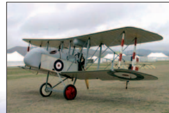
Exposición de la Aviación.

En la 'galería de cristal' del Club LA PROVINCIA se muestra una amplia exposición cinematográfica de la aeronáutica, con motivo de la celebración del centenario de la aviación en el Archipiélago. Abierta de lunes a viernes de 18.00 a 22.00 horas los días laborables.